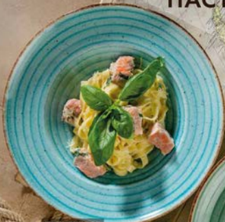
ТАЛЬЯТЕЛЛЕ С ЛОСОСЕМ